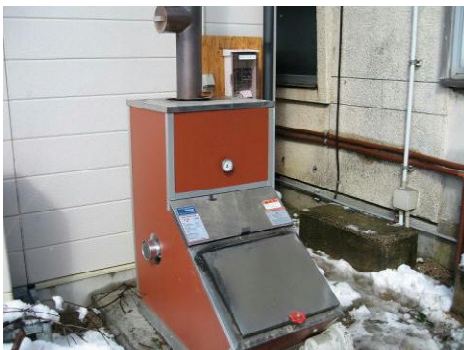
【役場頓原庁舎の薪ボイラー】

飯南町役場農林課(頓原庁舎) 飯石郡飯南町頓原2319 TEL : 0854-72-0313(代)