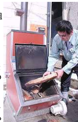
飯南町役場頓原庁舎に設置された「まきボイラー」に間伐材を入れる職員

財政が窮迫する中、町はまきストーブで少しでも懐を温めたいところ。今冬の灯油代は例年の半分程度になる見込みで、同町農林課は「ボイラー設置費と、まき購入代を含め、コストを検証したい」としている。