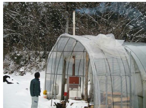
【都加賀農園の薪ボイラー】